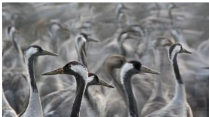
Aves Grouse no Hula Lake Park.

Um surto de gripe aviária matou mais de 5 mil aves grouse _____, levando as autoridades a declararem uma reserva natural popular proibida aos visitantes e alertar sobre uma possível escassez de ovos, já que as aves locais serão eliminadas como precaução.